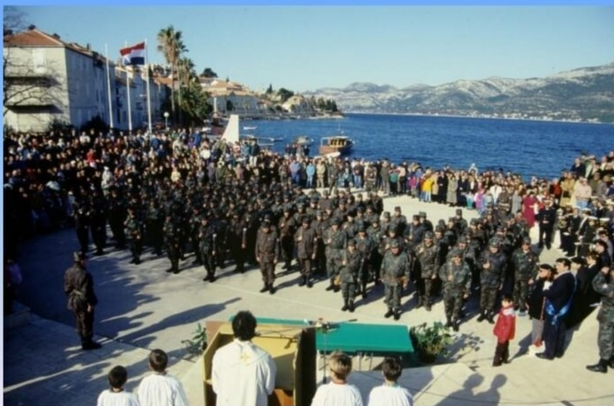
U sastavu pješačke bojne obrane općine Korčula bile su : 1 Orebička, 2. Korčulanska, 3. Blatska i 4. Veloluška satnija. Na slikama prisega 2. Korčulanske satnije